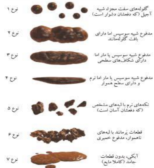
تصویر شماره ۲: مقیاس مدفوع بریستول برای تعیین نوع مدفوع

روزانه توسط خود بیمار پر شد. حین انجام پژوهش، ۴ نفر (۲ نفر از گروه طب فشاری، ۲ نفر از گروه نقاط کاذب) به دلیل مسافرت و بستری در بخش ویژه، از نمونه‌ها خارج شدند و در نهایت ۳۰ نفر در هر گروه مطالعه را به پایان رساندند. ابزار گردآوری داده‌ها شامل پرسشنامه مشخصات جمعیت‌شناسی، پرسشنامه استاندارد و ترجمه شده به زبان فارسی روم ۳ و ابزار بریستول بودند. متغیرهای مربوط به مشخصات جمعیت‌شناسی شامل: سن، جنس، وضعیت تأهل، تعداد افراد خانواده، سطح تحصیلات، شغل، سطح درآمد، سابقه درمان با دیالیز، میزان فعالیت فیزیکی بود. از معیار روم ۳، برای تعیین ابتلا به یبوست بیماران که شامل ۶ آیتم بود، استفاده شد. بیماری که ۲ تا ۶ آیتم را حداقل در ۶ ماه قبل گزارش می‌کردند، مبتلا به یبوست محسوب می‌شدند (۱۹). از ابزار بریستول برای تعیین کیفیت و قوام مدفوع بیماران استفاده شد که در این ابزار، دفع طبیعی قوام متوسط و رنگ طبیعی دارد. قوام‌های مختلف مدفوع در تصویر شماره ۲ بریستول ارائه شده است.